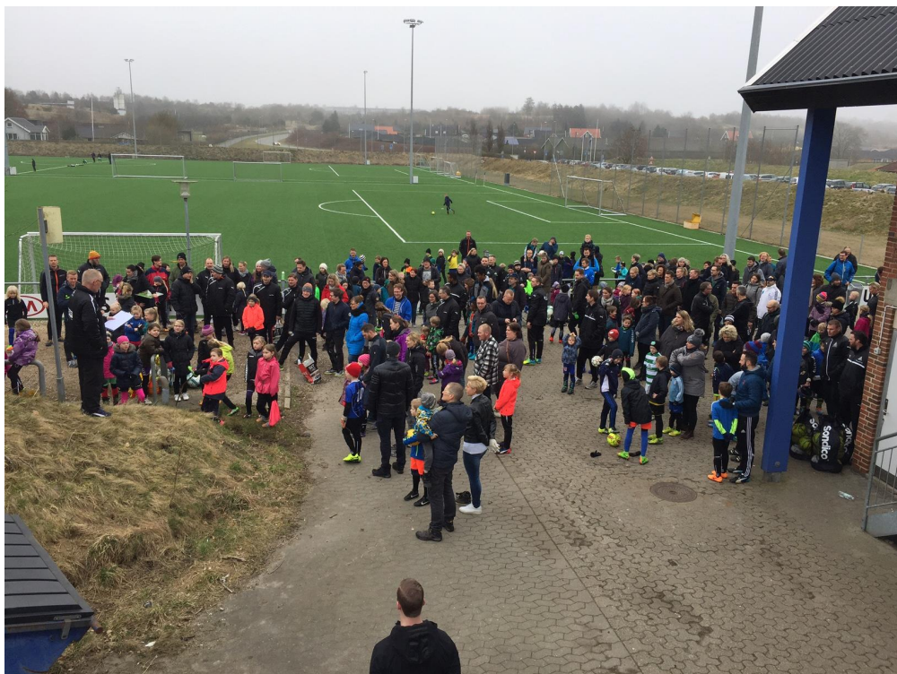
Alle bydes velkommen

Spillerne og deres forældre blev budt velkommen til sæsonstarten, hvorefter det var tid til at komme ud i sine årgange og få trænet en lille smule.