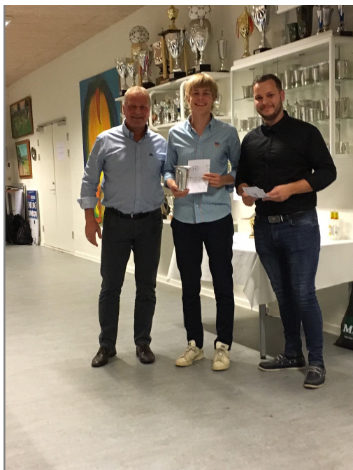
Årets spiller flankeret af formand og seniorformand

Efter de obligatoriske taler m.v. blev festen sluppet løs - og de sidste gik først hjem langt hen på natten - og var klar til at blive lagt i seng.