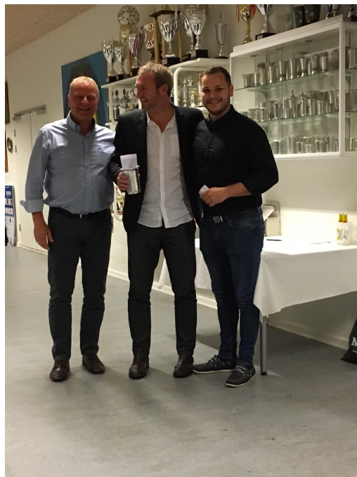
Årets SIK'er flankeret af formand og seniorformand