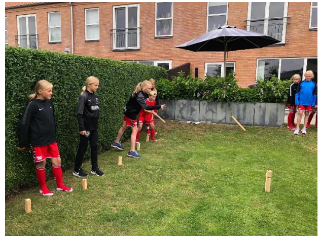
Hygge & kammeratskab 😊

Pigerne er efterhånden en flok der kender hinanden rigtig godt, men også en flok som meget gerne byder velkommen til nye fodboldkammerater, og et par nye er også kommet til. Skulle der nu gå en fodboldglad pige rundt som har lyst til et fantastiske kammeratskab på et hold som vægter både fodbold, kammeratskab og socialt samvær både på og udenfor banen så er der selvfølgelig altid plads til flere fodboldglade piger.