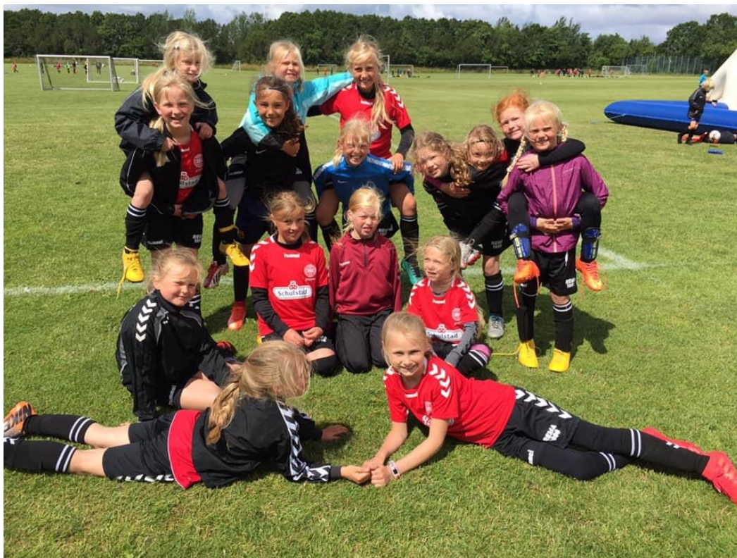
Fodboldskole 2019 . Kammeratskab, sjov, læring og sammenhold ©

Rigtige fodboldpiger hepper selvfølgelig på kvindelandsholdet. Så vi håber på sejr når U10-pigerne sidder klar på stadion med røde/hvidt flag på kinderne og lungerne fulde af luft til at heppe på kvinderne, når de løber på banen til kamp mod Malta.