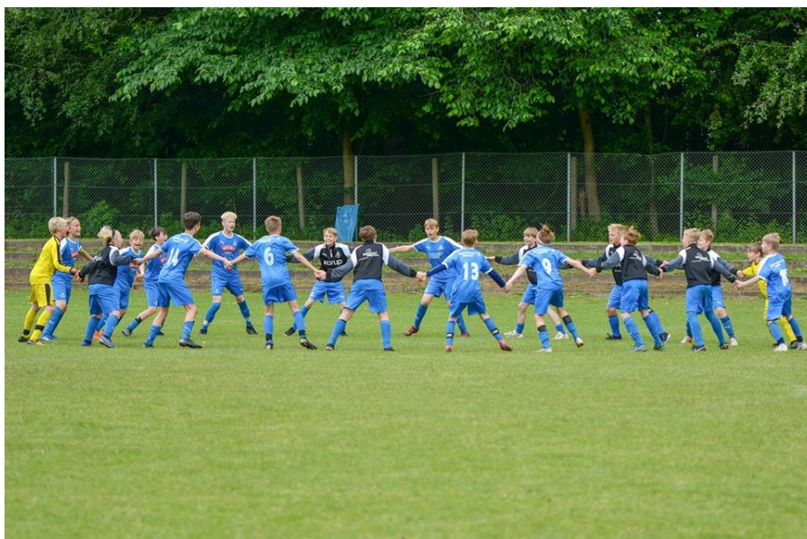
En fantastisk tur hvor kammeratskab, hygge og fodbold gik op i en højere enhed.