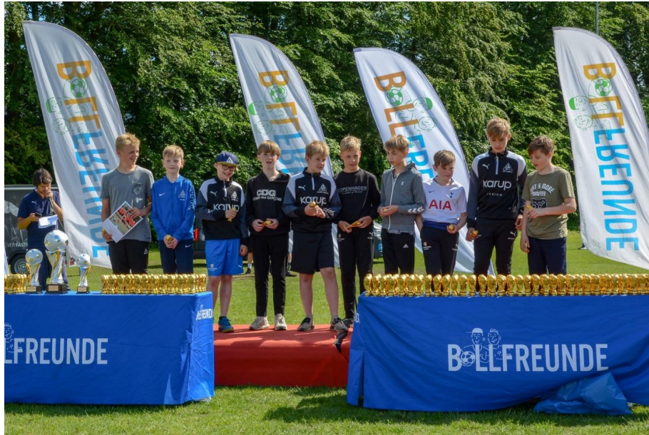
Sik1 gik hele vejen og vandt i Finalen 3-1 over et andet dansk hold HOG Hinnerup.