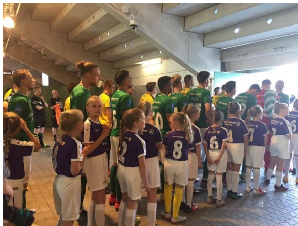
Spændte fodboldpiger, klar til indløb på Viborg stadion.

Inden de fleste piger startede sommerferien med en uge på fodboldskole, blev der lige tid til en fælles oplevelse på Viborg stadion, hvor pigerne fik oplevelsen af at lave indløb til kampen mellem Viborg og Hobro. Bagefter var der højt humør blandt pigerne på tilskuerpladserne på trods af at Viborg måtte se sig besejret.