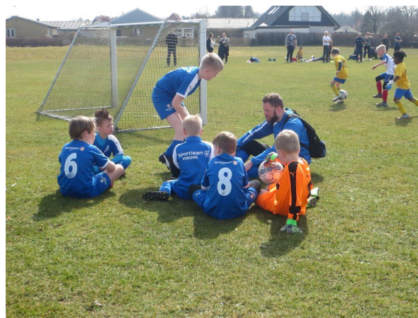
Trænerteamet i U-9 drenge